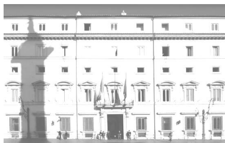
Governo - Ministero della Giustizia

Il Consiglio dei Ministri si è riunito lunedì 10 luglio 2017 alle ore 18.30 e, tra l'altro, ha approvato i seguenti provvedimenti: